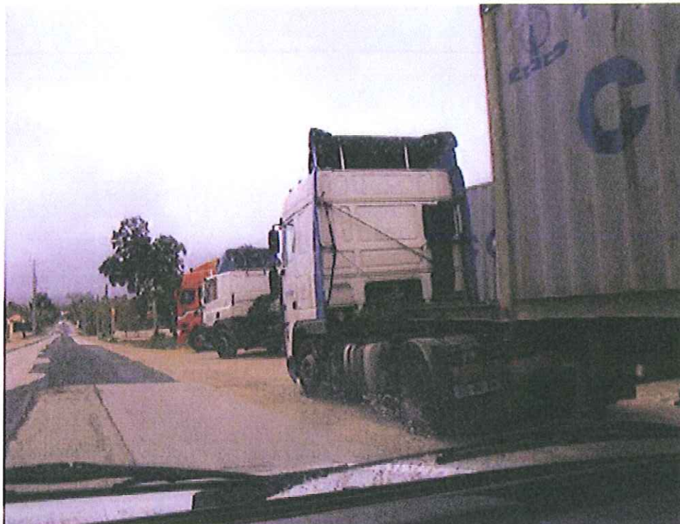
Estrada de Minde...ao longo de Boleiros..... excessivas cargas diariamente ..... Justificação???