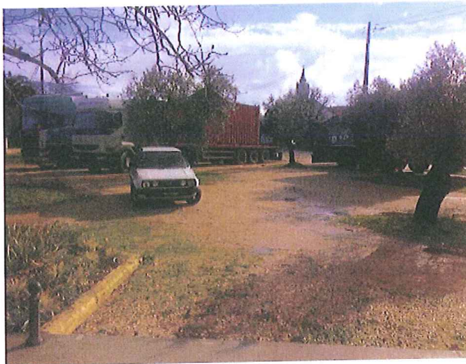
Largo de Boleiros a metros de escola primária..... excessivas cargas e casas ..... Justificação???