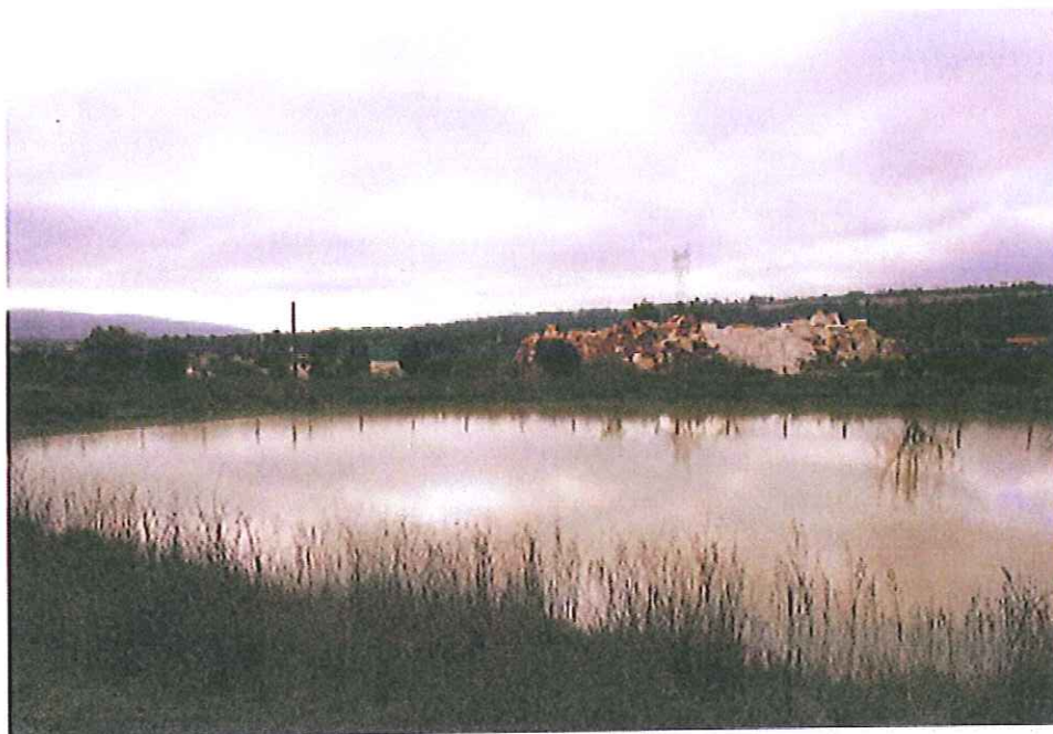
A 'nossa' lagoa de Boleiros em vias de extinção