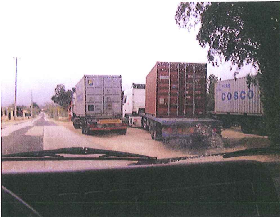
Estrada de Minde...ao longo de Boleiros..... excessivas cargas diariamente ..... justificação???