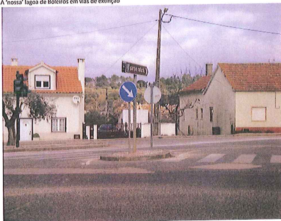
NB: A entrada de Boleiros, placa indica Parque Natural (PNSAC) ..... pedreira à vista