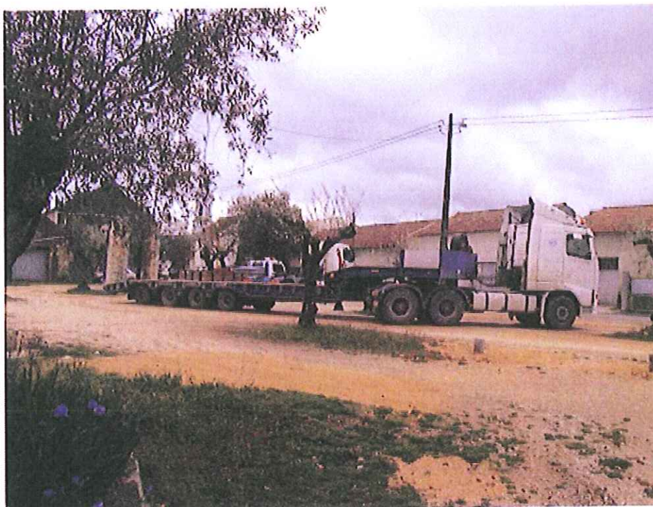
Largo de Boleiros a metros de escola primária..... excessivas cargas e casas ..... justificação???