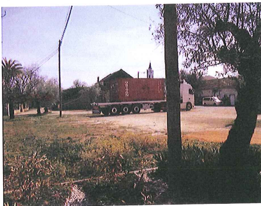
Largo de Boleiros a metros de escola primária..... excessivas cargas e casas ..... Justificação???