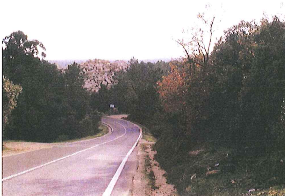
Vista a caminho de Ourem..... Representação vergonhosas para turistas ..... Justificação???