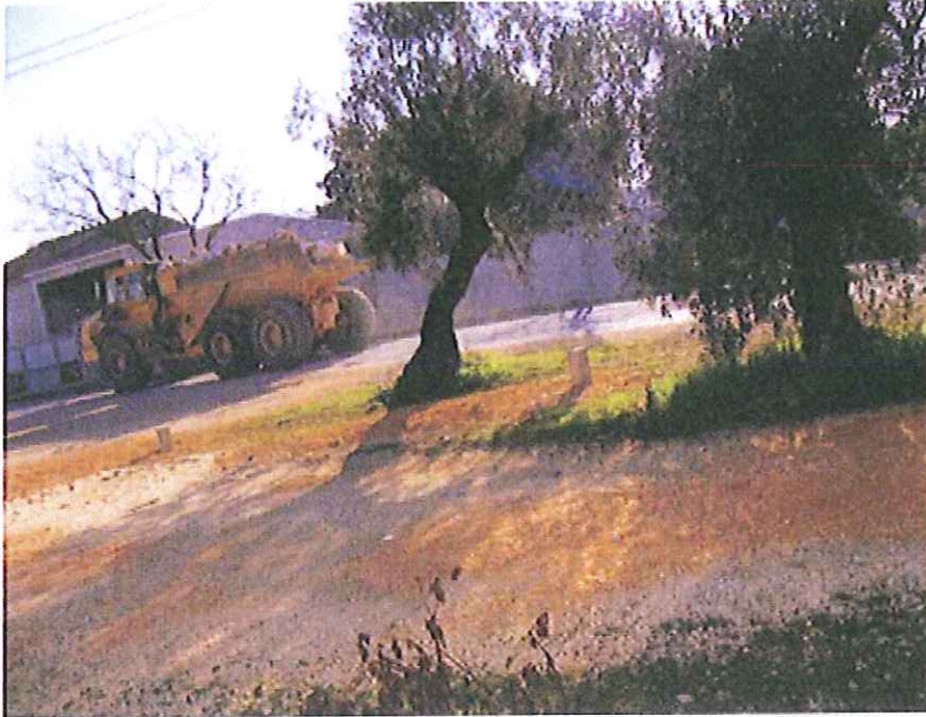
Largo de Boleiros a metros de escola primária..... excessivas cargas, rotina diária..... Justificação???