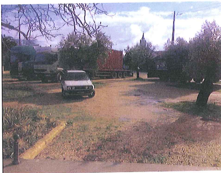
Largo de Boleiros a metros de escola primária..... excessivas cargas e casas ..... justificação???