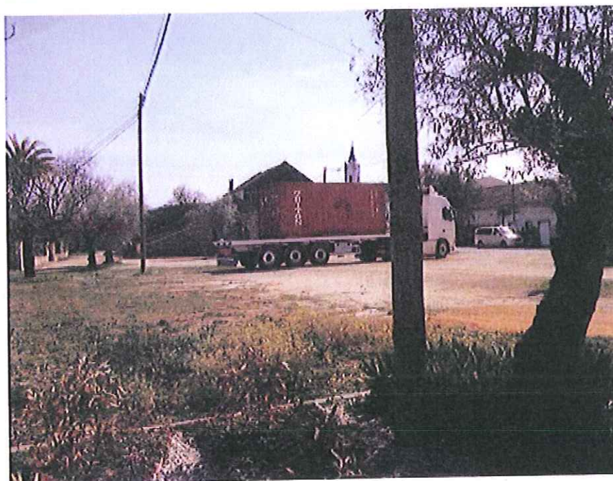
Largo de Boleiros a metros de escola primária..... excessivas cargas e casas ..... justificação???