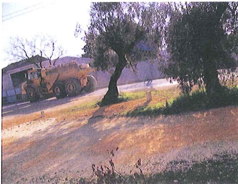
Largo de Boleiros a metros de escola primária..... excessivas cargas, rotina diária..... Justificação???