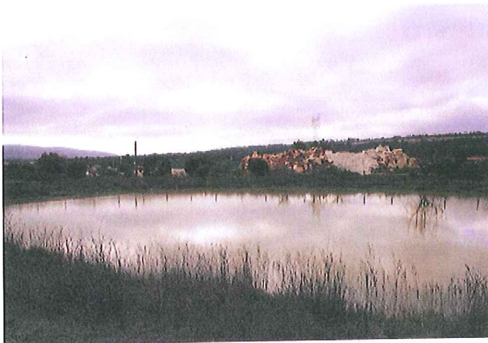
A 'nossa' lagoa de Boleiros em vias de extinção