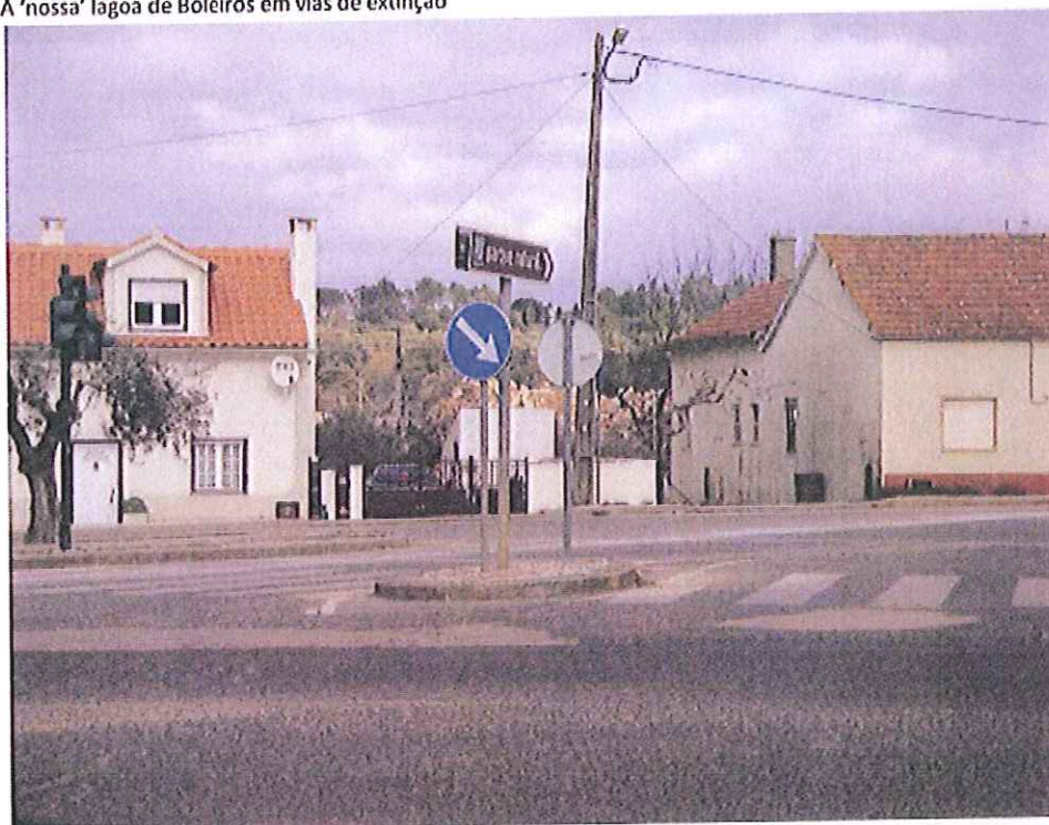
NB: A entrada de Boleiros, placa indica Parque Natural (PNSAC) ..... pedreira à vista