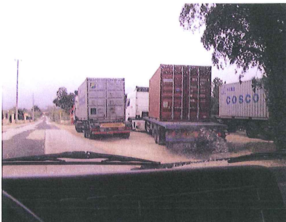
Estrada de Minde...ao longo de Boleiros..... excessivas cargas diariamente ..... justificação???