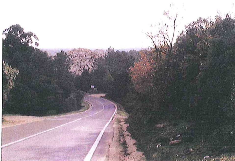
Vista a caminho de Ourem..... Representação vergonhosas para turistas ..... Justificação???