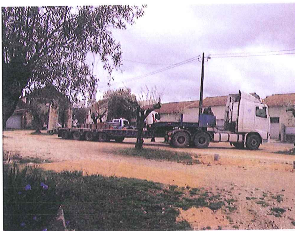
Largo de Boleiros a metros de escola primária..... excessivas cargas e casas ..... justificação???