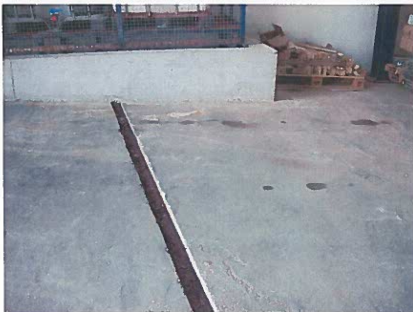
Foto 9 - Caleira de águas pluviais contígua à bacia de retenção dos produtos líquidos para consumo no processo (visita técnica em 23/11/2018)