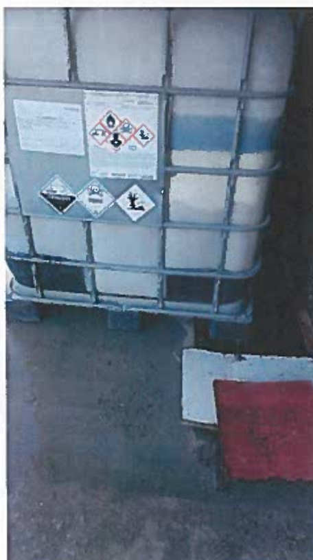
Foto 15 – Contentores de plástico com produtos líquidos instalados na área existente entre o Edifício 2 e o Edifício 3, a noroeste da ETARI (pormenor do canal atrás dos contentores da foto 11 - visita técnica em 23/11/2018)