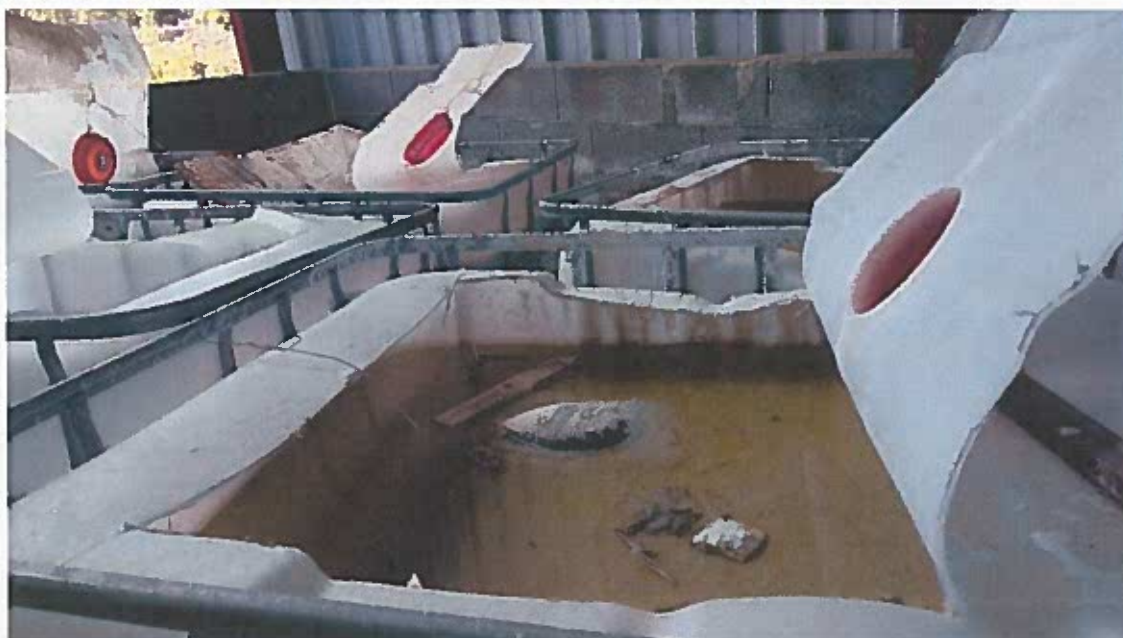
Foto 18 – Contentor de líquidos danificado e utilizado para armazenar uma mistura líquida localizado na zona indicada no EIA como destinada ao armazenamento de lamas (visita técnica em 23/11/2018)