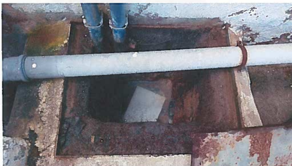
Foto 4 - Caixa de descarga do efluente tratado na ETARI (visita técnica em 23/11/2018)