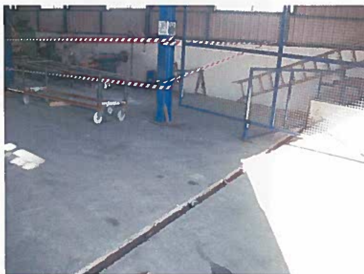
Foto 10 - Caleira de águas pluviais contígua à bacia de retenção dos produtos líquidos para consumo no processo (visita técnica em 23/11/2018)