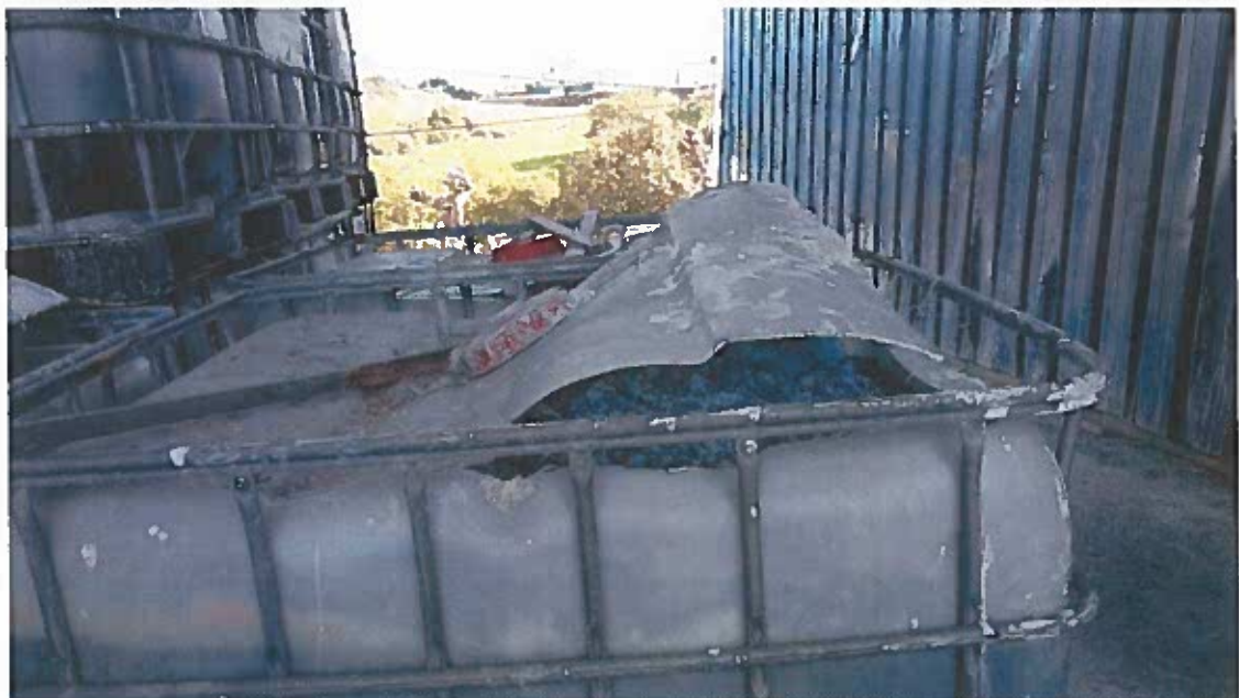
Foto 20 – Contentor de líquidos danificado e utilizado para armazenar lamas da ETARI, localizado na zona indicada no EIA como destinada ao armazenamento de lamas (visita técnica em 23/11/2018)