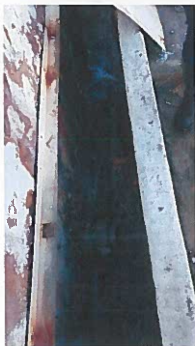
Foto 6 - Canal onde aflui a descarga do efluente tratado da ETARI e todas as outras tubagens (Visita técnica em 23/11/2018)