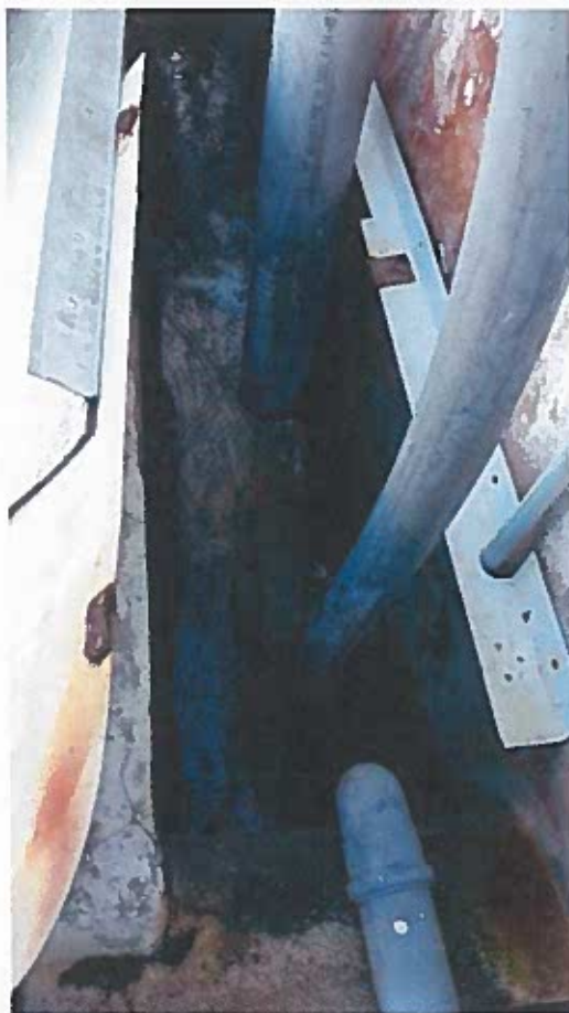
Foto 5 - Canal onde aflui a descarga do efluente tratado na ETARI e todas as outras tubagens (visita técnica em 23/11/2018)