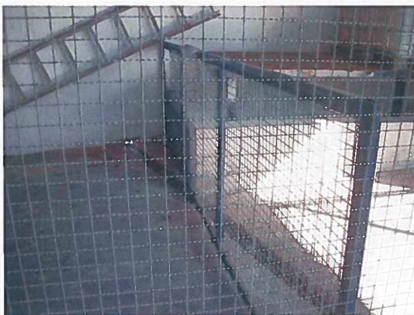
Foto 11 - Caleira de águas pluviais contígua à bacia de retenção dos produtos líquidos para consumo no processo (visita técnica em 23/11/2018)