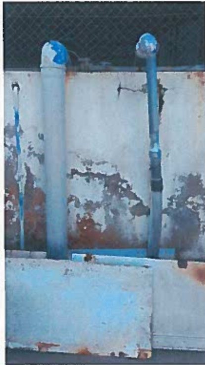
Foto 7 – Tubagens que também afluem ao canal de descarga do efluente tratado da ETARI (visita técnica em 23/11/2018)