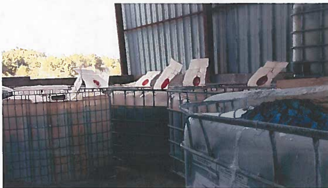
Foto 16 – Zona indicada no EIA como destinada ao armazenamento de lamas. (visita técnica em 23/11/2018)