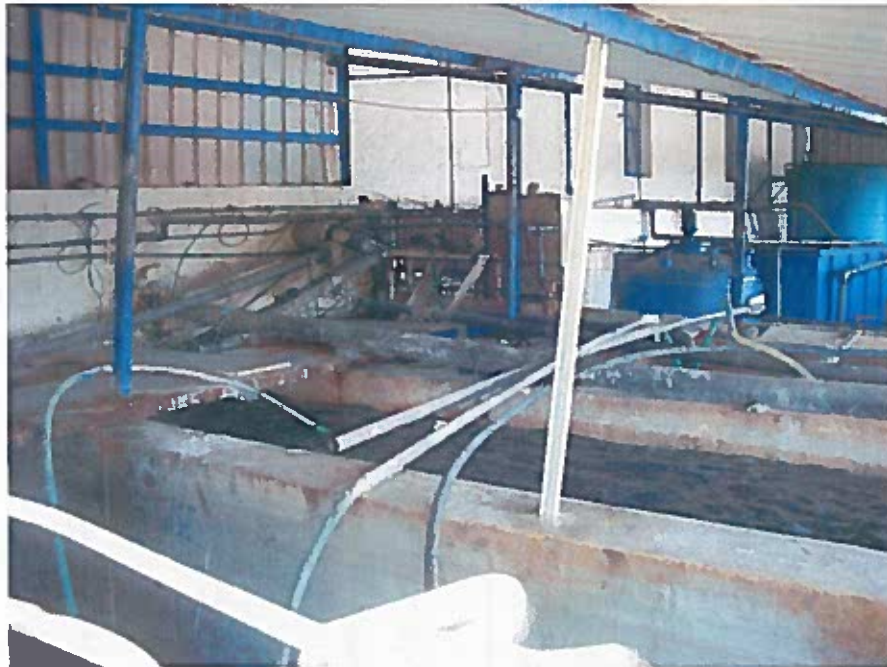
Foto 1 - Vista dos tanques da ETARI durante a visita técnica em 23/11/2018