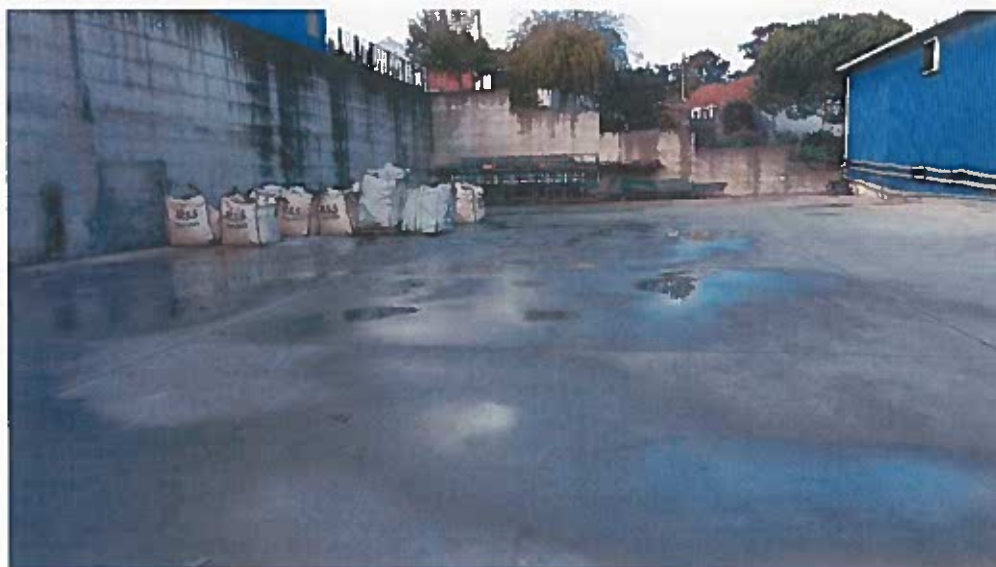
Foto 13 - Big bags contendo lamas perigosas localizados na área existente entre o Edifício 2 e o Edifício 3 (a noroeste da ETARI), em zona descoberta (Visita técnica em 23/11/2018)