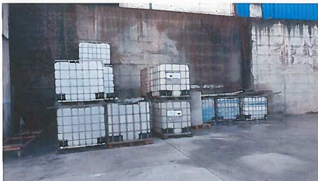
Foto 14 – Contentores de plástico com produtos líquidos na área existente entre o Edifício 2 e o Edifício 3, a noroeste da ETARI (visita técnica em 23/11/2018)