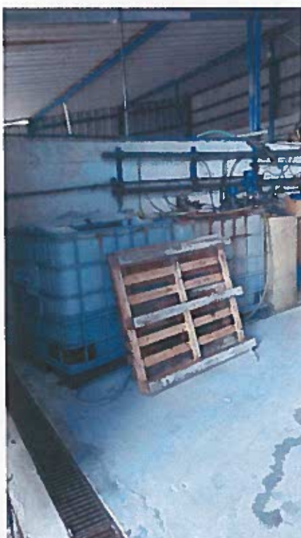
Foto 3 - Vista da ETARI durante a visita técnica em 23/11/2018