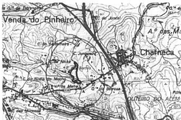
Figura 1 – Extrato da Folha 403 da carta militar, à escala 1/25000 com a implantação do projeto.

Na documentação apresentada não é claro se esta situação foi investigada.