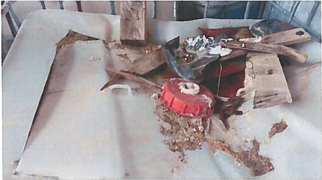
Foto 19 -Contentor de líquidos danificado e utilizado para armazenar lamas localizado na zona indicada no EIA como destinada ao armazenamento de lamas(visita técnica em 23/11/2018)