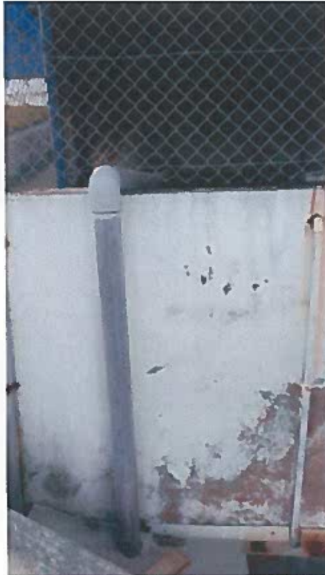
Foto 8 -Tubagens que também afluem ao canal onde aflui a descarga do efluente tratado na ETARI (visita técnica em 23/11/2018)