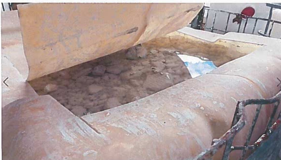
Foto 17 -Contentor de líquidos danificado e utilizado para armazenar sólidos/lamas, contendo também águas pluviais localizado na zona indicada no EIA como destinada ao armazenamento de lamas (visita técnica em 23/11/2018)