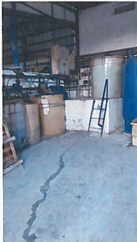
Foto 2 - Vista da ETARI durante a visita técnica em 23/11/2018