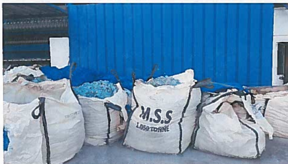
Foto 12 – Big bags contendo lamas perigosas localizados junto à ETARI em zona descoberta (visita técnica em 23/11/2018)