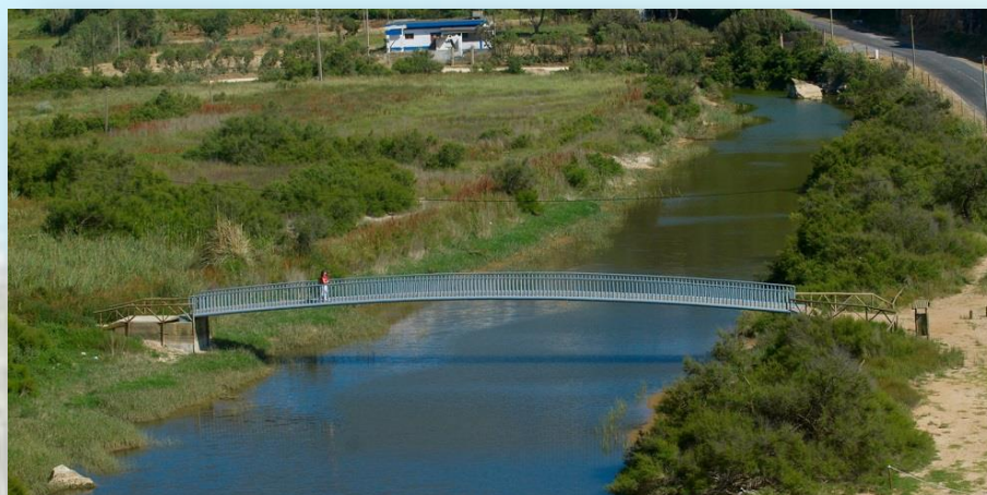
Vale do Safarujo – CM Mafra

Este foi o percurso do 100.º passeio do projeto “Roteiros Aventura”, organizado pela Câmara Municipal de Mafra. Para assinalar este marco, escolheu-se o vale do Safarujo, um dos mais belos do Concelho de Mafra. O rio que lhe dá o nome nasce na Malveira e atravessa toda a Tapada Nacional da Mafra, desaguando na Praia de S.