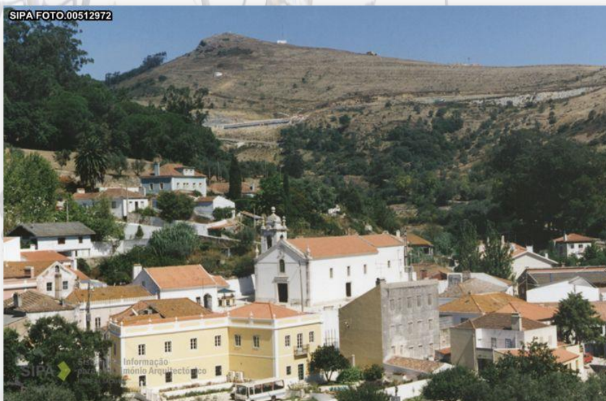
Ponte de Lousa

Recomendamos a visita à capela do Espírito Santo, localizada no extremo oposto da povoação.