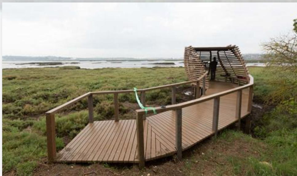
Posto de observação de aves - CM Seixal

O traçado deste trilho faz parte de uma rede de 42km de percursos pedestres que pretende divulgar os recursos naturais, biodiversidade e património construído do município do Seixal, nas duas áreas vitais no contexto do nosso território: Baía do Seixal e Zona Húmida Adjacente e parte do Sítio de Importância Comunitária Forno