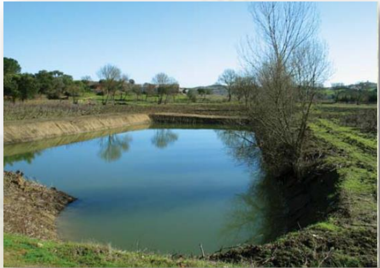
Charca - CM Azambuja

O percurso “Terras de Pão” tem início junto ao largo em frente ao edifício da Junta de Freguesia. O percurso é inicialmente percorrido em parte do povoado em direção a Longas. Daqui continua até Vale Lobos, deixando a parte urbana e entrando no campo que se encontra dividido em parcelas de terreno cultivado pelas gentes da terra. Seguindo neste trilho vamos por Paúles, passamos a “Charca”, pequeno lago no meio dos terrenos, e encontramos nas Catujeiras, seguindo em direção ao Parque das Merendas, lugar aprazível onde pode fazer uma pequena paragem, para um pequeno lanche retemperador e usufruir do espaço.