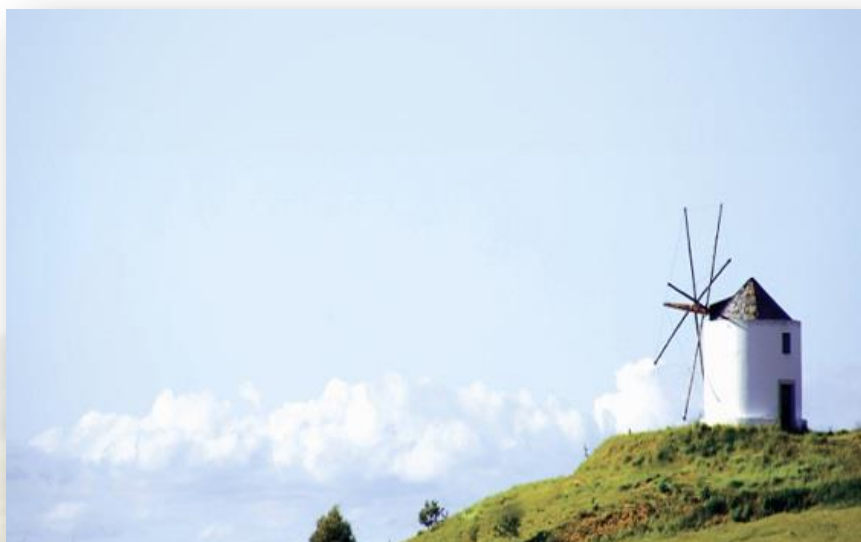
Moinho de Maçussa - CIMLT

A fauna mais representativa da região em termos de mamíferos será porventura o