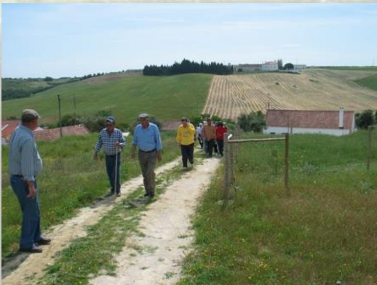
Terras de Pão - CM Azambuja

Subimos o Vale da Guerra, nesta parte do percurso o cultivo da terra dá lugar a grandes extensões de vinhas do tão apreciado vinho da região, orgulho dos produtores locais.