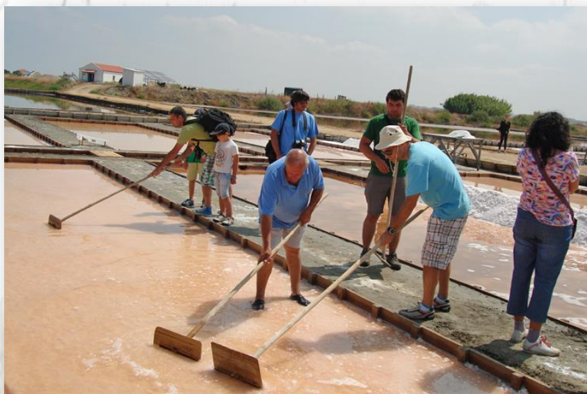
Salinas do Samouco

Atualmente, as salinas de Samouco apresentam-se como o salgado com a maior riqueza e abundância de aves durante o período de preia-mar de todo o Tejo. A subida da maré faz com que esta imensa planície de lodo fique praticamente inacessível e é nas Salinas que muitas aves vão procurar refúgio. A sua importância crescente deve-se, essencialmente, a dois aspetos: em primeiro lugar tem sido alvo de manutenção constante desde 1995 e, em segundo lugar, os outros