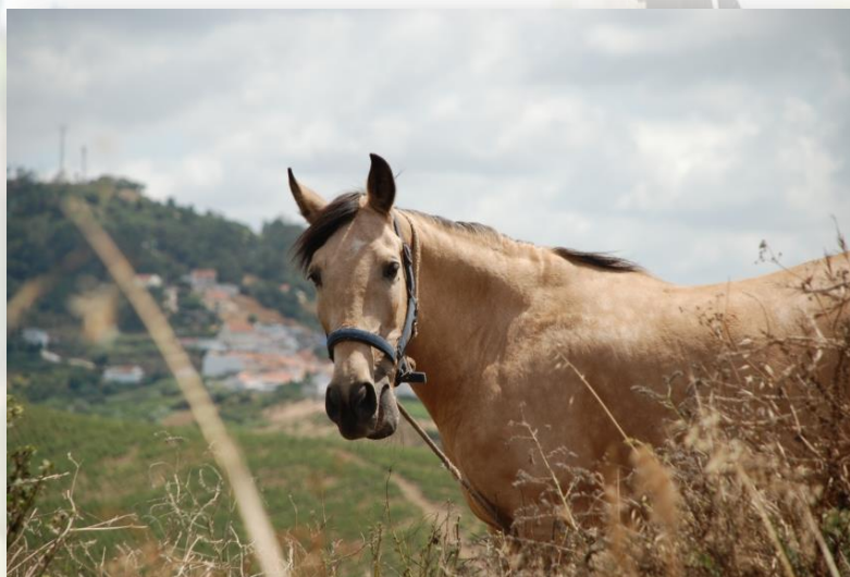
CM Torres Vedras

A derivação ocorre no centro da Freiria, junto ao Largo do Jardim onde se encontra o painel informativo. Local onde os pedestrianistas podem optar por realizar o percurso total 14km ou apenas parte dele 8km ou 6km, conforme as opções e indicações que seguir. Se optar por realizar os 8km deve fazê-lo seguindo a indicação de Chãos. Se, optar por seguir até à Serra da Romã e Serra do Romeirão, de rara beleza paisagística e ambiental, percorre mais 6km.