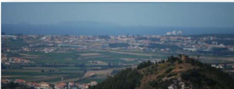
CM Torres Vedras

O início do percurso encontra-se no jardim central em frente à Igreja Matriz de São Lucas. A partir daqui os pedestrianistas podem optar por fazer o percurso total em direção a Chãos ou em direção à Serra da Romã e Serra do Romeirão.