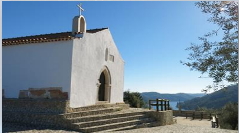
Capela de S. Pedro de Castro - JF Ferreira do Zêzere

Durante todo o percurso temos uma paisagem deslumbrante podendo avistar as localidades da aldeia da Pombeira, Zaboeira, Castanheira, e Maxial, a maravilhosa albufeira de Castelo do Bode e as suas águas límpidas. À beira Zêzere encontramos a riqueza histórica da Capela São Pedro do Castro. Observamos também as localidades de Chão da Serra, Castelo, Cerejeira, e tantas outras, noutra espectro de orientação.