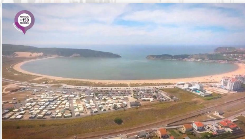
São Martinho do Porto

São vários os edifícios históricos que se vão encontrando ao longo da Rua Cândido dos Reis: a casa da família Jordão Pereira, uma das antigas, construída na 2ª metade do séc. XIX, o edifício da antiga Lota, o edifício da Colonia Balnear da Empresa “Cimentos de Leiria”, construído em 1936 é hoje propriedade da Cimpor, a Casa abrigo do Salva-vidas construída nos anos 30 e desactivada em