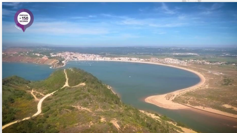
São Martinho do Porto ao fundo - CM Alcobaça

Segue-se depois por estrada de terra batida, na direcção Norte e percorre-se o caminho sobre as arribas. Costa acidentada e rochosa, as encostas encontram-se cobertas por mantos rasteiros e pode-se ver a praia da Gralha assim como recantos de grande beleza natural. Do lado Este, situados nas colinas que se estendem a norte do morro de St.º António, avistam-se os moinhos que funcionaram até final dos anos 50. Sempre por caminhos rurais, percorrendo o relevo de baixa