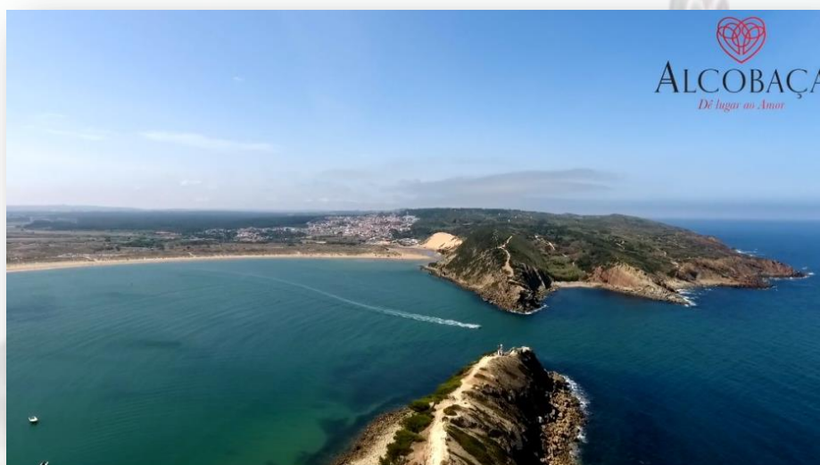
São Martinho do Porto - CM Alcobaça

O percurso inicia-se na Praça Eng.º José Frederico Ulrich. À direita o Palacete “Casa das Palmeiras”, construído nos finais do século XIX por Vitorino Frois relembra o Romantismo Tardio em Portugal. Segue-se em direcção aos cais, uma das referências mais importantes de São Martinho do Porto. Proporciona um agradável passeio numa zona criada para uso pedestre onde é possível avistar as tradicionais traineiras de apanha submarina de algas. No início do cais encontra-se um pilar com data do início da construção 1828.