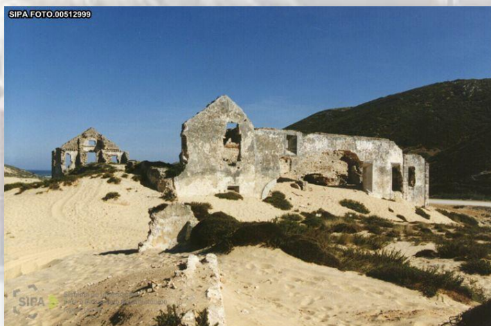
Ruínas do Antigo Convento de Penafirme - DGPC (SIPA)

Junto ao monumento ao poeta Kazuo Dan, por cima da praia de Santa Helena, também conhecida por praia de Santa Cruz, aproveite para descansar, pois a jornada até aqui foi de 6,0 km, encontra aqui um painel informativo que o orientará na escolha a prosseguir.