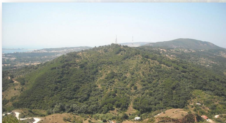
Serra dos Gaiteiros - CM Palmela

O percurso percorre também os sítios arqueológicos do Alto da Queimada e Castro de Chibanes (Serra do Louro) e o Banco de Ostras Fossilizadas (Serra do Louro, junto ao marco geodésico da Queimada). É também na Serra do Louro que os moinhos de vento se localizam maioritariamente.