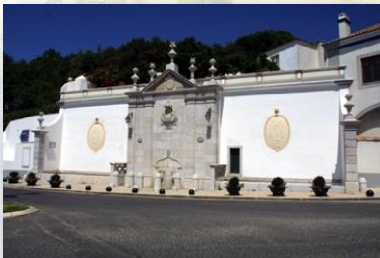
Chafariz D. Maria I - CM Palmela

Durante todo o percurso avista-se a cordilheira da Arrábida com as Serras de São Luis, São Francisco e Arrábida.